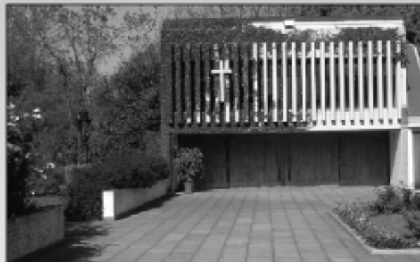
Capilla Pablo Nogués